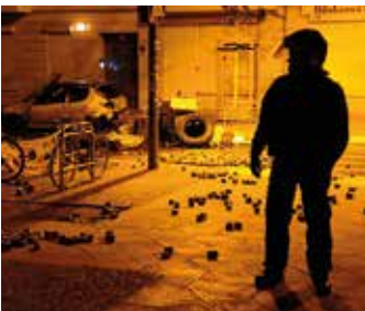
Linksautonome in Berlin – No-Go-Area für Polizisten

Eine gewisse Offenheit und Transparenz sowohl in ihrem politischen als auch persönlichen und ideologischen Auftreten ist für dieses Agieren wesentlich. Zugute kommt den Postautonomen dabei, dass sie, im Gegensatz zu den „klassischen“ Autonomen, in der Regel lebensälter, zumeist gut ausgebildet und oftmals beruflich etabliert sind. Das wiederum ermöglicht es ihnen, vielfältige Netzwerke bis weit in die bürgerliche Gesellschaft hinein zu knüpfen und diese für ihre politischen Ziele zu instrumentalisieren. 48