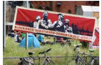
Transparent des No-G20 aus Hamburg

Beide postautonomen Bündnisse wirkten an führender Stelle bei der Planung und Durchführung von Protesten gegen politische Großereignisse mit. So mobilisierten 2017 neben den „klassischen“ Autonomen auch die IL und das uG gegen den G20-Gipfel in Hamburg. Vor allem die IL wirkte in dem „No-G20-Bündnis“ zusammen mit demokratischen Organisationen wie Attac und Parteien wie „Die Linke“ mit und versuchte, die Protestbewegung zu dominieren. Während die bzw. der „klassische“ Autonome vor allem durch Gewaltexzesse auffiel, versuchten Postautonome, an den Gipfeltagen die Zufahrtswege zum Gipfelort und die Hamburger Innenstadt zu blockieren. Dadurch banden sie die Polizeikräfte und schufen so den Raum für autonome Gewalttaten in den Teilen von Hamburg, die von der Polizei kaum mehr zu schützen waren. Auch im Nachhinein haben sich beide Bündnisse weder von den Gewalttaten distanziert noch die daran beteiligten Gruppierungen verurteilt. So heißt es bei der IL mit Blick auf die gewalttätigen Aktionen: „Wir haben schon vorher gesagt, dass wir uns nicht distanzieren werden und dass wir nicht vergessen werden, auf welcher Seite wir stehen.“ 58