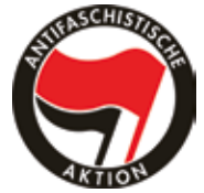
Logo der Antifaschistischen Aktion